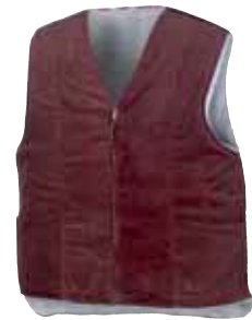
Artikel: 4201 braun