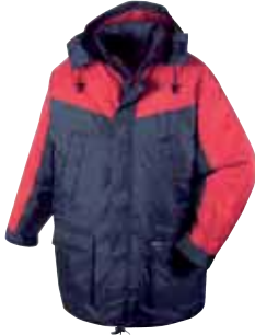
Artikel: 4135 marine/rot