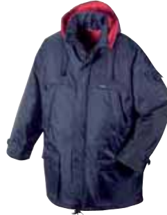
Artikel: 4134 marine/rot