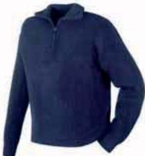
Artikel: 8701 marine