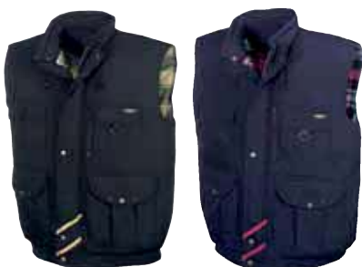
Artikel: 4258 schwarz 4259 marine

Alle Artikel dieser Seite erhalten Sie in den Größen S - XXXL.