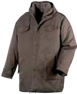
Artikel: 4102 steingrau