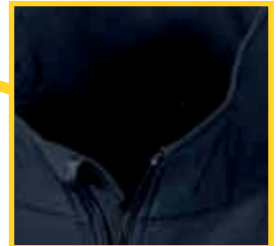
weiches Fleece material innen