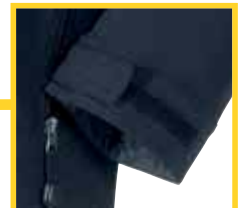
regulierbarer Klettverschluss an den Ärmeln