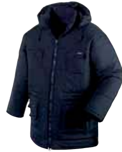
Artikel: 4100 marine