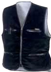
Artikel: 4200 schwarz